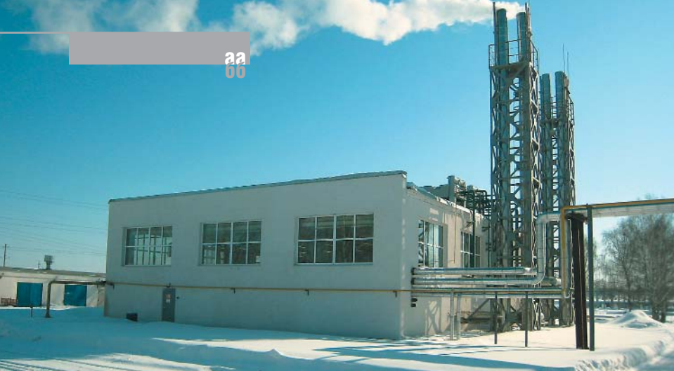
Энергокомплекс на базе газовых электростанций FG Wilson и пиковая котельная

строительство собственного завода по производству железобетонных изделий в поселке Курмоч. Завод был построен «с нуля» в крайне сжатые сроки, вследствие чего необходимо было своевременно обеспечить его электрической и тепловой энергией для технологического процесса производства бетона.