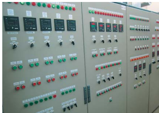
Система автоматического управления (щит собственных нужд)

Для решения стоящих перед предприятием задач в качестве партнера была выбрана компания «Хайтед», обладающая опытом реализации подобных проектов, наработанной базой проектных и инженерных решений в области когенерации.